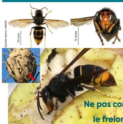
Frelon asiatique ( Vespa velutina )