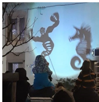
Spectacle « Animalia »