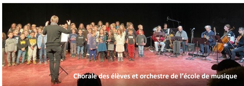
Chorale des élèves et orchestre de l'école de musique