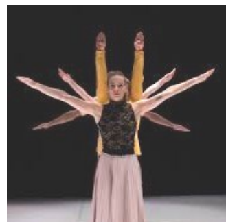
Spectacle « Les Autres »